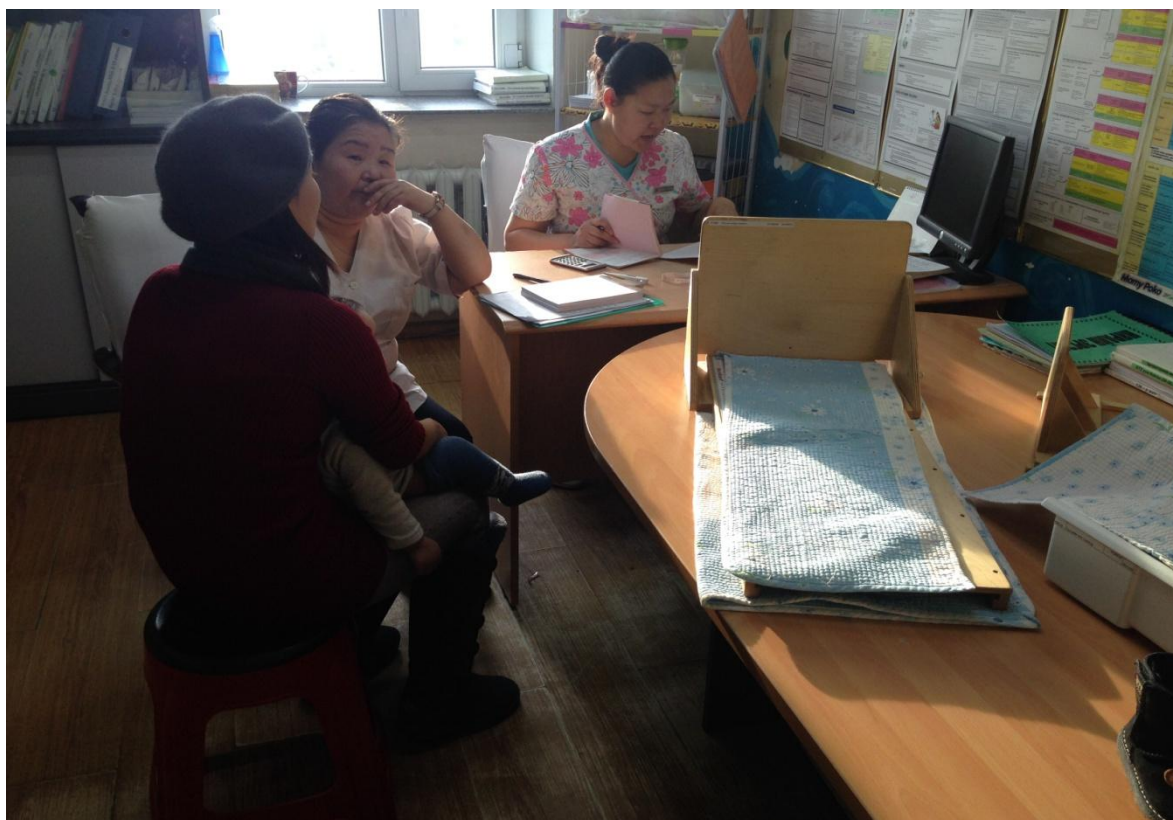
Зураг 13: ЧД-ийн 12-р хорооны өрхийн эмнэлэгийн өдөрлөг