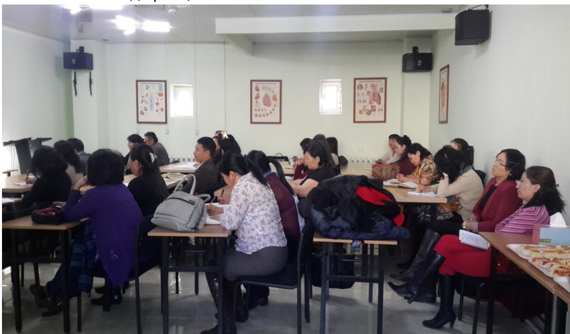
Зураг 4: Оролцогчид

илтгэл танилцуулж, 6 дүүргийн ЭМН-болон өрхийн эмнэлэгүүдийн нийт 20 эмч албан хаагчид оролцлоо.