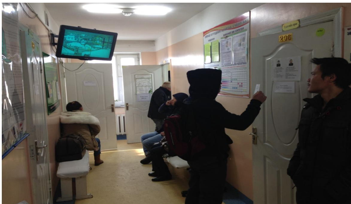
Зураг 12: ЧД-ийн 12-р хорооны өрхийн эмнэлэгийн өдөрлөг