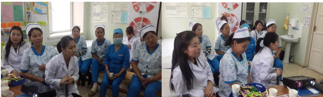
Зураг 7: БЗД-ийн 21-р хорооны өрхийн эмнэлэгийн эмч ажилчид

БЗД-ийн 21-р хорооны өрхийн эмнэлэгийн сургалт 2014 оны 12-р сарын 5 - ны өдөр болж нийт 13 эмч ажилчид оролцлоо. УБЦАТ-с: “Улаанбаатар хотын агаарын бохирдол”, “ Агаарын бохирдлыг бууруулахад бидний үүрэг, оролцоо” сэдвүүдээр илтгэл бэлтгэн танилцуулан, цаашид хамтран ажиллах талаар санал солилцлоо.