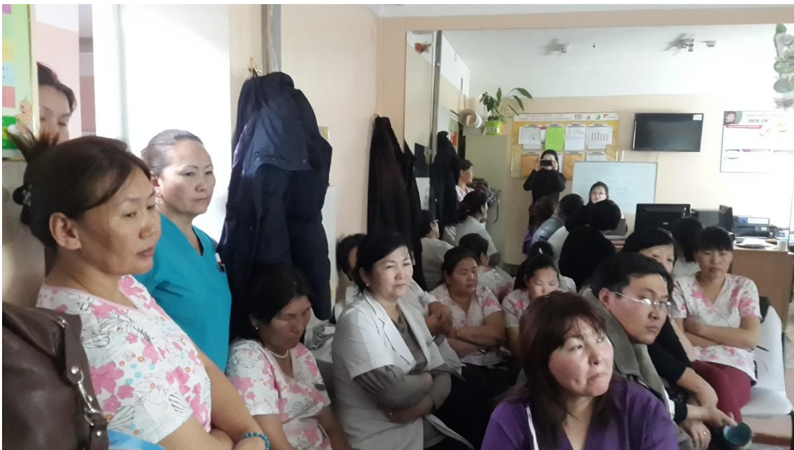
Зураг 6: ЧД-ийн 12-р хорооны өрхийн эмнэлэгийн эмч ажилчид

БЗД-ийн 21-р хорооны өрхийн эмнэлэгийн сургалт 2014 оны 12-р сарын 5 - ны өдөр болж нийт 13 эмч ажилчид оролцлоо. УБЦАТ-с: “Улаанбаатар хотын агаарын бохирдол”, “ Агаарын бохирдлыг бууруулахад бидний үүрэг, оролцоо” сэдвүүдээр илтгэл бэлтгэн танилцуулан, цаашид хамтран ажиллах талаар санал солилцлоо.