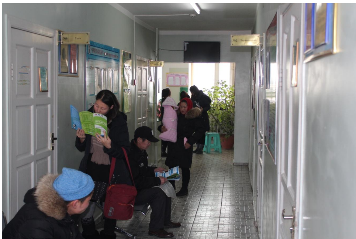
Зураг 14: БЗД-ийн 21-р хорооны өрхийн эмнэлэгийн өдөрлөг