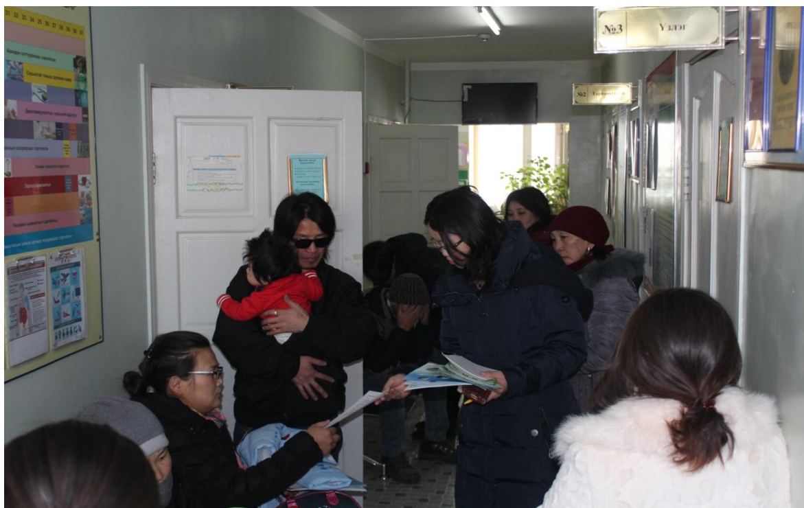
Зураг 14: БЗД-ийн 21-р хорооны өрхийн эмнэлэгийн өдөрлөг