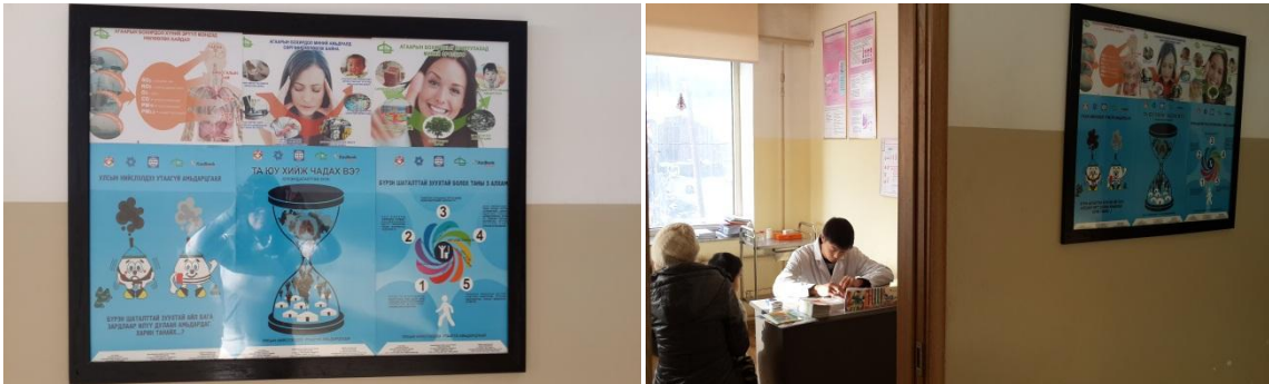
Зураг 11: БГД-ийн 22-р хорооны өрхийн эмнэлэгийн өдөрлөг