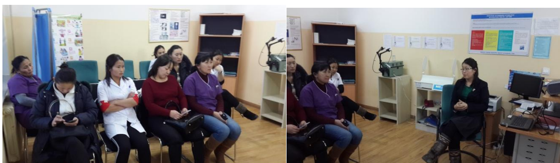
Зураг 5: БГД-ийн 22-р хорооны өрхийн эмнэлэгийн эмч ажилчид

БГД-ийн 22-р хорооны өрхийн эмнэлэгийн сургалт 2014 оны 12-р сарын 2- ны өдөр болж өнгөрсөн ба БГД-ийн 10-р, 22-р хорооны нийт 9 эмч ажилчид оролцлоо. УБЦАТ-с: “Улаанбаатар хотын агаарын бохирдол”, “ Агаарын бохирдлыг бууруулахад бидний үүрэг, оролцоо” сэдвүүдээр илтгэл бэлтгэн танилцуулж , иргэдэд агаарын бохирдлын талаар мэдээ мэдээлэл олгох өдөрлөгийн талаар санал солилцлоо. 22-р хорооны өрхийн эмнэлэгийн ажилчид дараах саналыг дэвшүүлсэн нь: