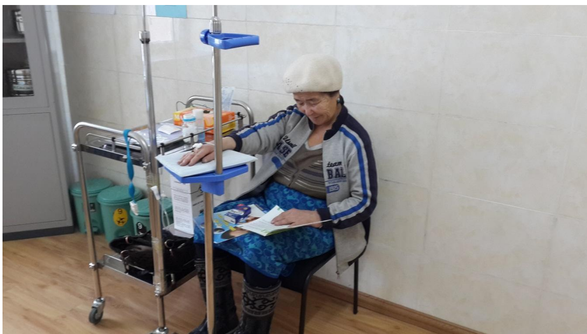
Зураг 9: БГД-ийн 22-р хорооны өрхийн эмнэлэгийн өдөрлөг