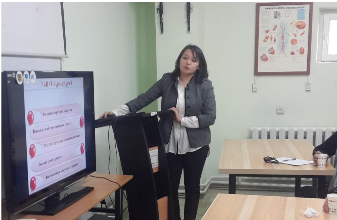
Зураг 1: УБЦАТ-ийн талаархи илтгэл