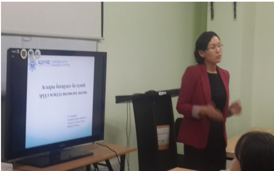
Зураг 3: Агаарын бохирдол ба хүний эрүүл мэндэд үзүүлэх нөлөө илтгэл

илтгэл танилцуулж, 6 дүүргийн ЭМН-болон өрхийн эмнэлэгүүдийн нийт 20 эмч албан хаагчид оролцлоо.