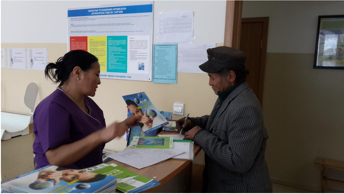
Зураг 10: БГД-ийн 22-р хорооны өрхийн эмнэлэгийн өдөрлөг