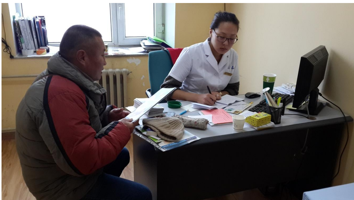
Зураг 8: БГД-ийн 22-р хорооны өрхийн эмнэлэгийн өдөрлөг